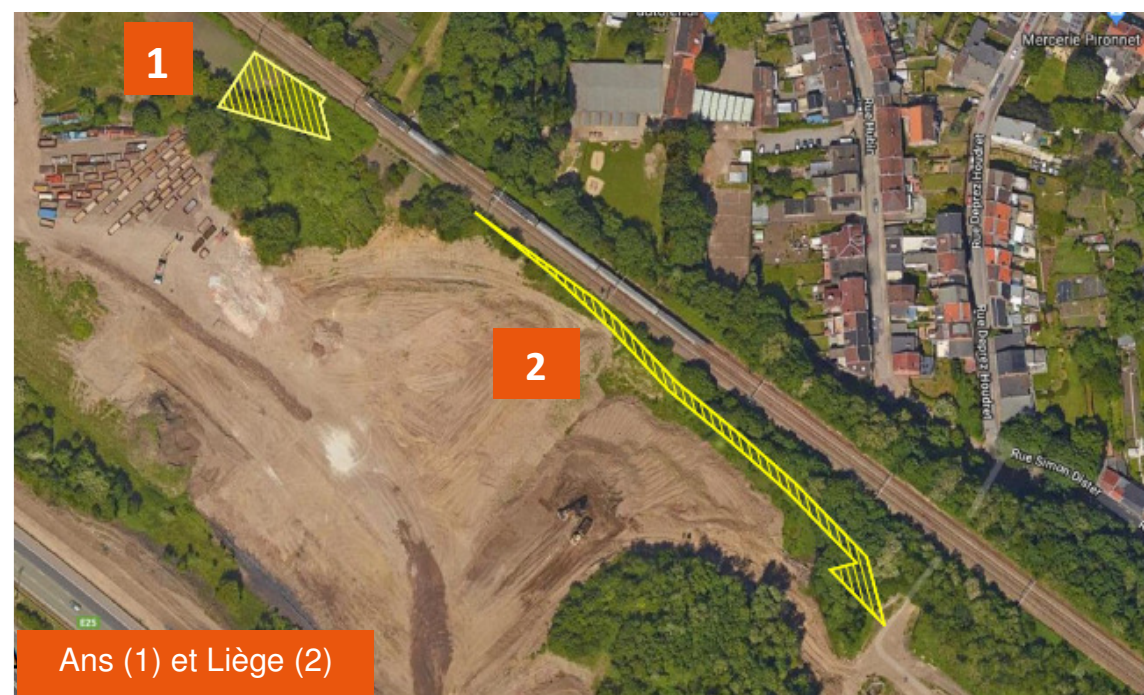
Ans (1) et Liège (2)

Offres à partir de : 37.800 EUR* ( 63,00 EUR/m 2 ) pour l'ensemble des deux parcelles