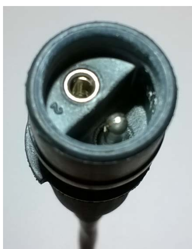
Figure 3 - Fiche de connexion de la sonde de température